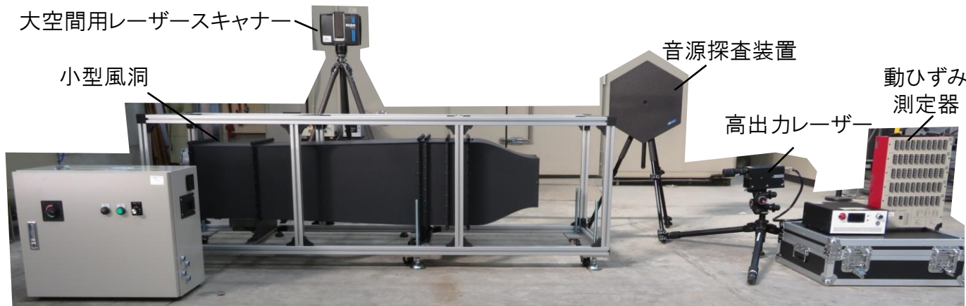
流体機械計測評価支援システム