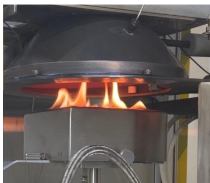
防火材料性能評価の様子

日時 : 令和8年2月26日 (木) 13:30~15:15 場所 : インテリア研究所 2階 研修室 定員 : 15名程度 参加費 : 無 料