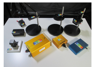
紫外線測定システム