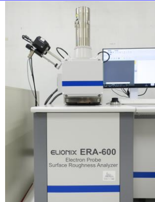
三次元粗さ解析走査電子顕微鏡

本セミナーでは表面の凹凸形状の観察及び観察視野の元素分析可能な三次元粗さ解析走査電子顕微鏡、及び表面熱処理やめっき膜等における微小領域の硬さ測定が可能な超微小押し込み硬さ試験機の概要や特徴、活用方法についてご紹介します。多くの皆様のご参加をお待ち申し上げます。